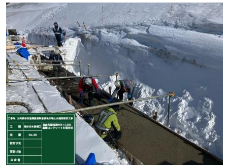
側溝の基礎コンクリート打設