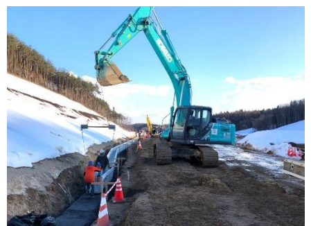
落蓋式側溝の布設作業