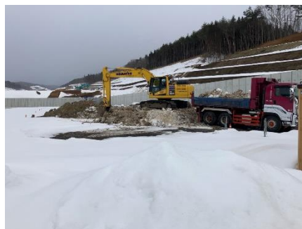
排雪状況（防災調整池）