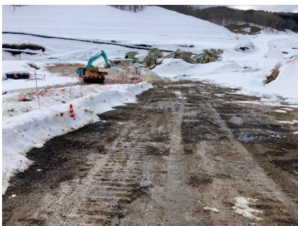
除雪状況（造成土改良機用地）