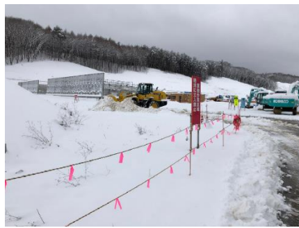
積雪状況（防災調整池）